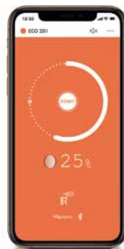
vysoká teplota v topeništi